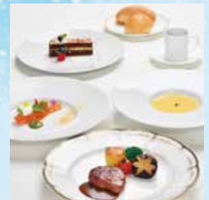
ルミナスランチコース Luminous Lunch Course