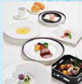
お箸で食べるふらんす懐石コース French "Kaiseki" Course