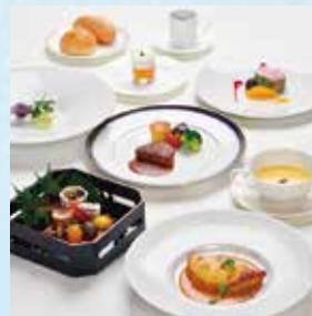
ルミナスコース 輝き Luminous Course