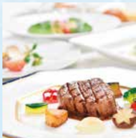
神戸牛コース Kobe Beef Course