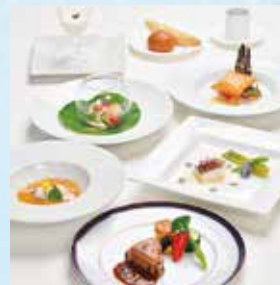
スペシャルコース Special Course