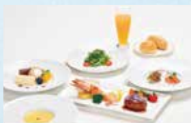
お子様コース Child Course