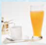
ケーキセット Cake Set